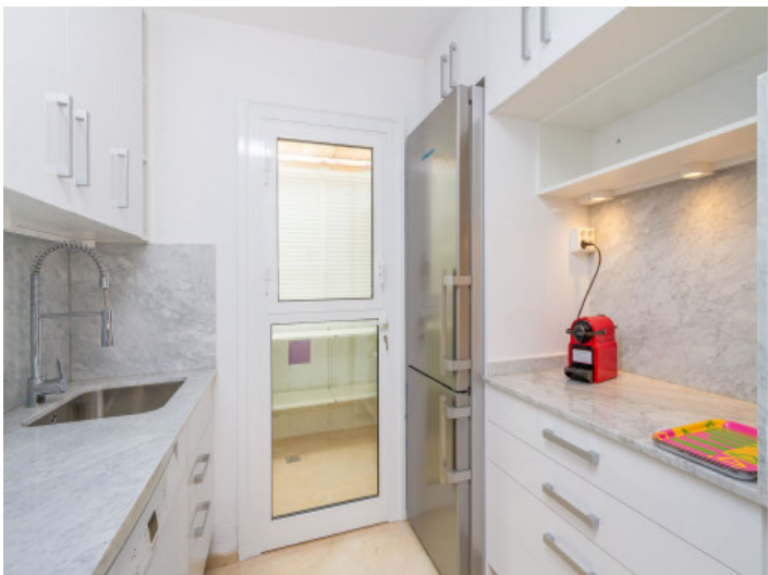
Küche mit Hauswirtschaftsraum