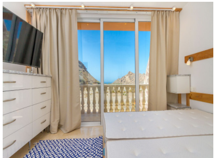
Schlafzimmer mit Meerblick

Alle Angaben nach bestem Wissen. Irrtum und Zwischenverkauf vorbehalten. Dieses Exposé ist eine Vorinformation, als Rechtsgrundlage gilt allein der notariell abgeschlossene Kaufvertrag.