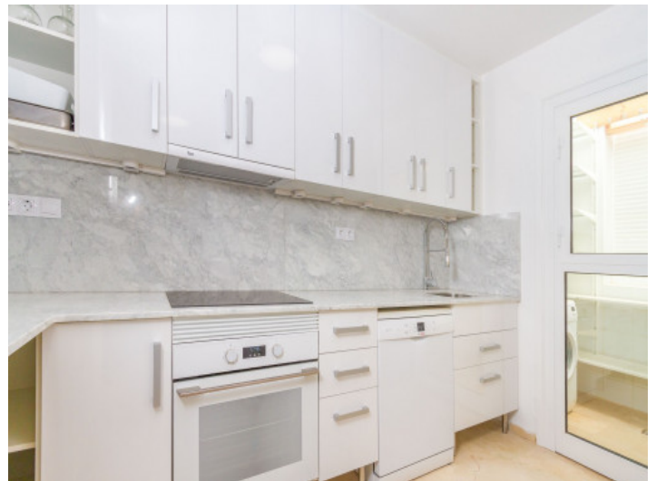
Voll ausgestattete Küche