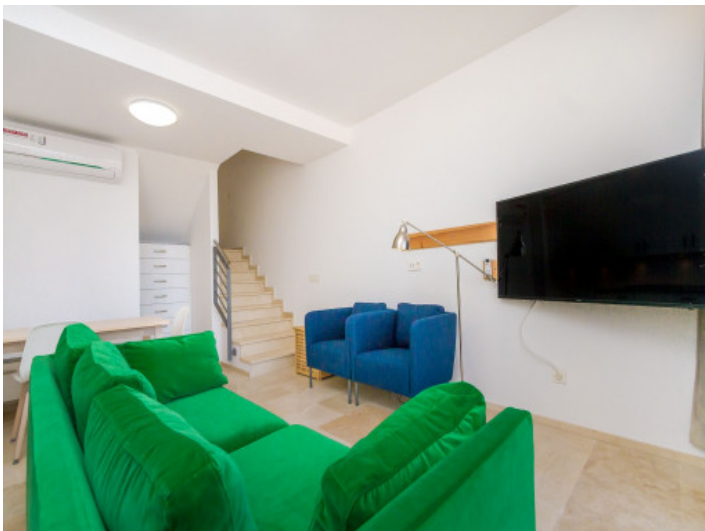
Alternative Ansicht des Wohnbereiches