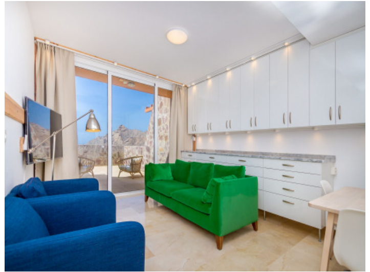
Wohnbereich mit Terrassenzugang