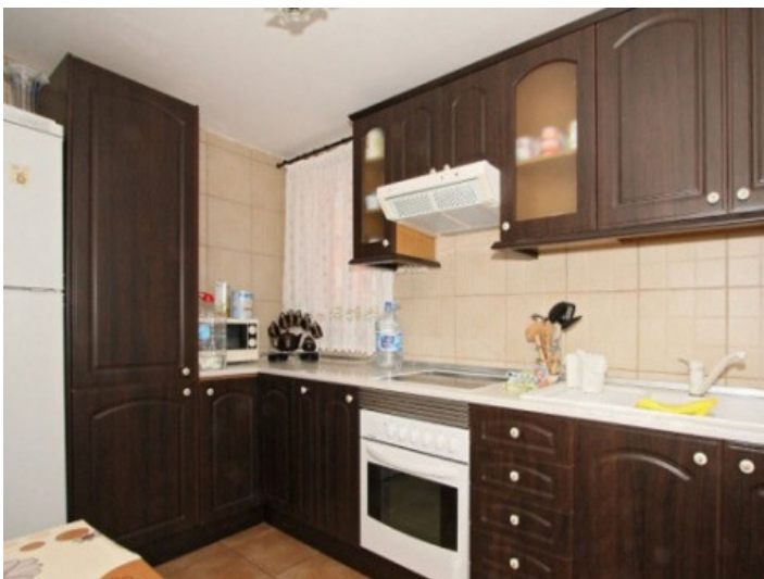
Moderne, voll ausgestattete Einbauküche