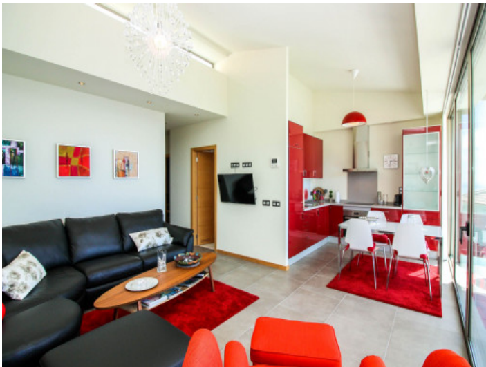
Offener Wohn-und Essbereich