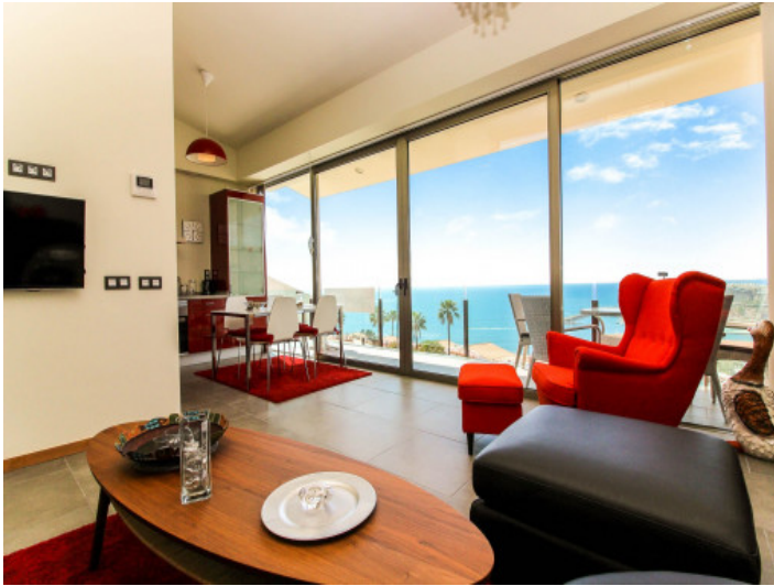
Beeindruckender Meerblick des Wohnbereiches