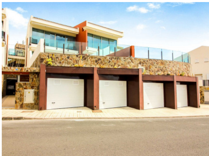
Außenansicht mit Garage

Alle Angaben nach bestem Wissen. Irrtum und Zwischenverkauf vorbehalten. Dieses Exposé ist eine Vorinformation, als Rechtsgrundlage gilt allein der notariell abgeschlossene Kaufvertrag.