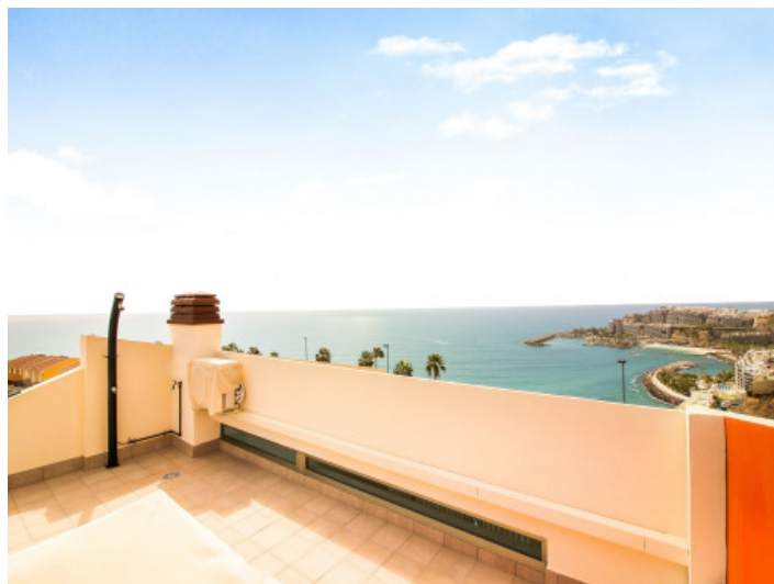
Dachterrasse mit Meerblick