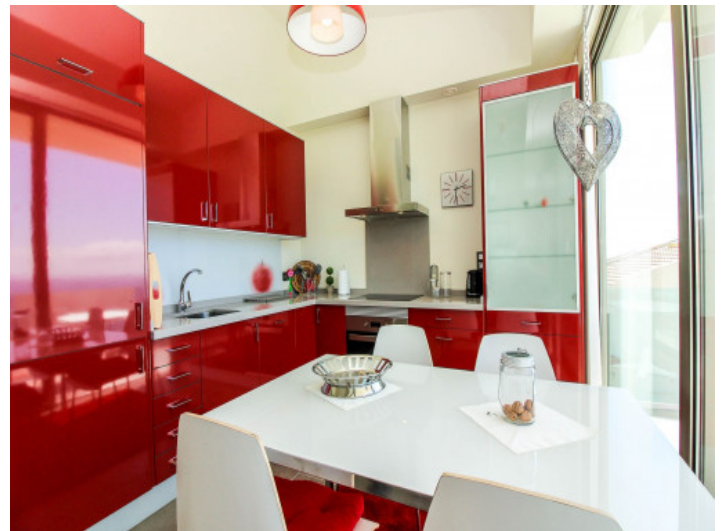
Voll ausgestattete Küche