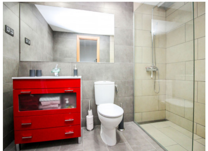
Modernes Badezimmer mit Dusche

Alle Angaben nach bestem Wissen. Irrtum und Zwischenverkauf vorbehalten. Dieses Exposé ist eine Vorinformation, als Rechtsgrundlage gilt allein der notariell abgeschlossene Kaufvertrag.